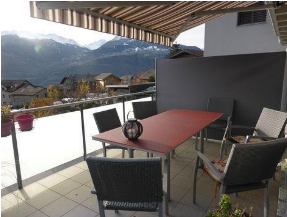
Balcon de 14,5 m2 avec vue dégagée, extérieur facile d'entretien.