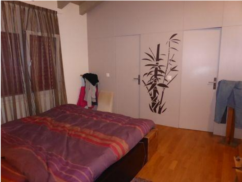
Suite parentale avec son dressing