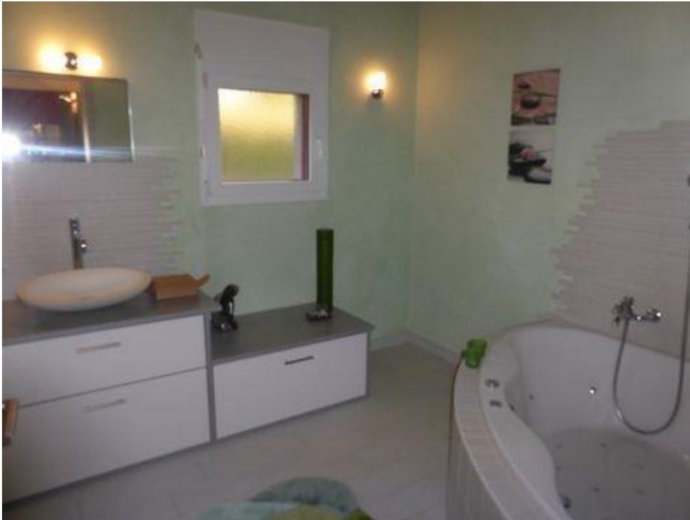
Salle de bain avec baignoire balnéo, wc visiteur et douche wc pour la suite parentale