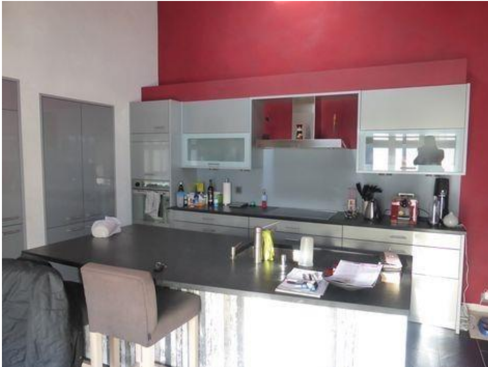
Cuisine moderne avec économat, ilot central