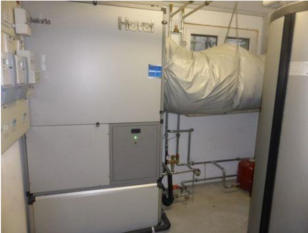
Pac air eau